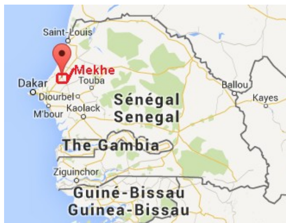
Gráfico 2. Ubicación geográfica de Mekhe.

Mekhe, a 130 kilómetros de Dakar, es una ciudad senegalesa de 15.291 habitantes; ubicada entre las provincias de Thiès y St. Louis, en el noroeste de este país y es también el nombre que se le atribuye a la segunda red construida en este trabajo.